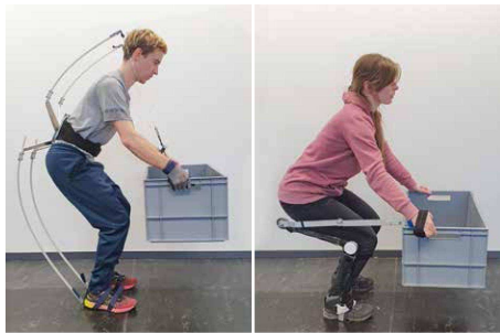
Erste Prototypen für das Exoskelett, das sich am Wirkprinzip des Heuschreckensprungs orientiert, sind fertig